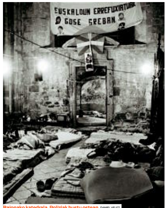
Baionako katedrala, Poliziak hustu ostean. DANIEL VELEZ