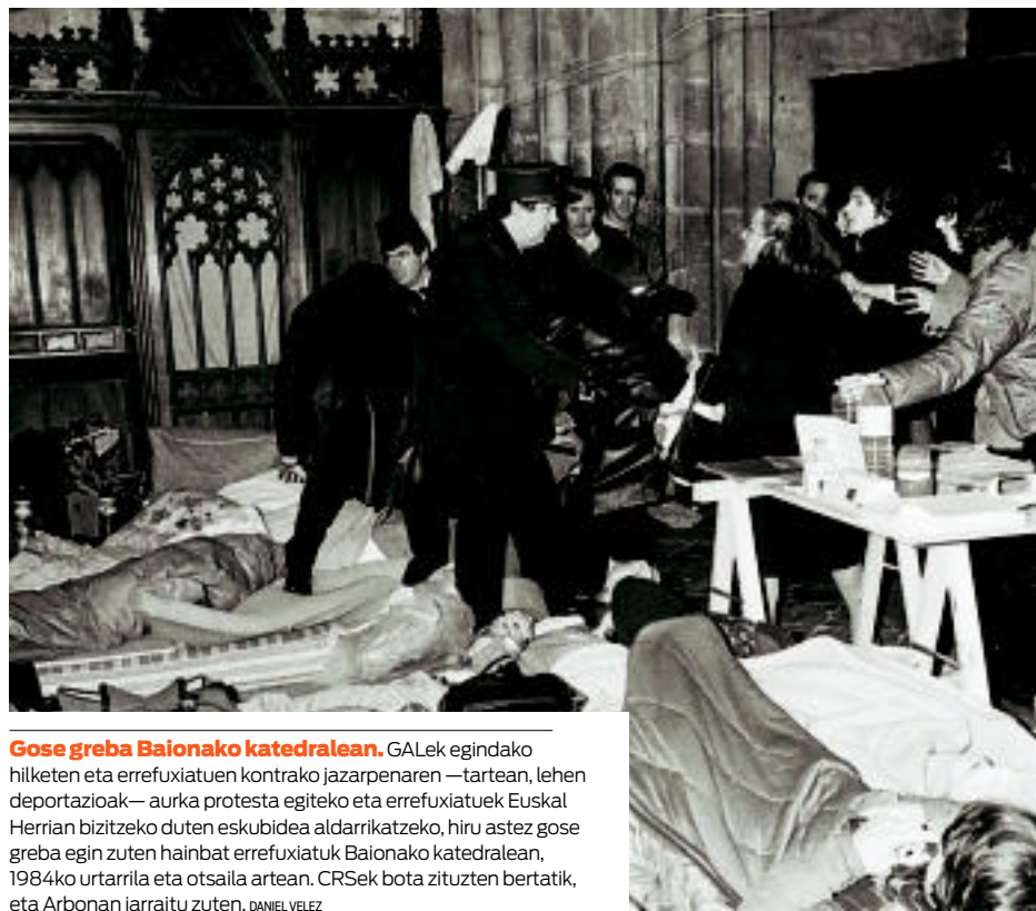
Gose greba Baionako katedralean. GALek egindako hilketen eta errefuxiatuen kontrako jazarpenaren —tartean, lehen deportazioak— aurka protesta egiteko eta errefuxiatuek Euskal Herrian bizitzeko duten eskubidea aldarrikatzeko, hiru astez gose greba egin zuten hainbat errefuxiatuak Baionako katedralean, 1984ko urtarrila eta otsaila artean. CRSek bota zituzten bertatik, eta Arbonan jarraitu zuten.